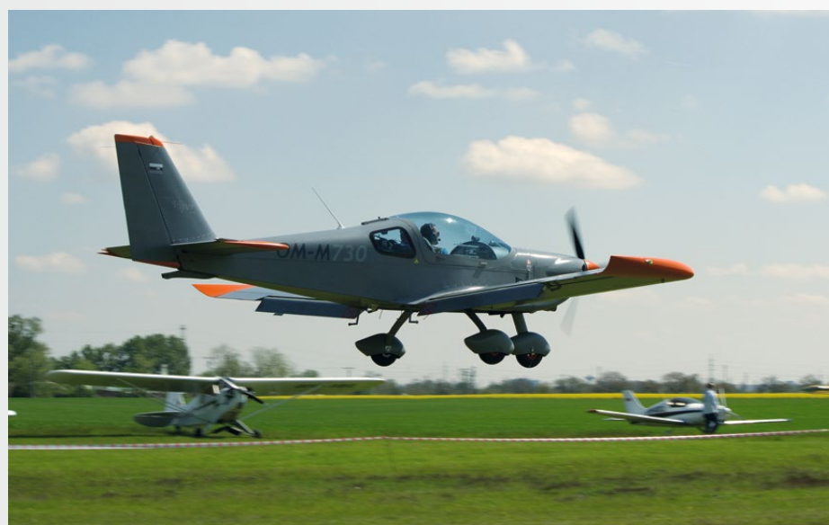
• Sládkovičovo, Otvorenie neba 1. máj 2017.