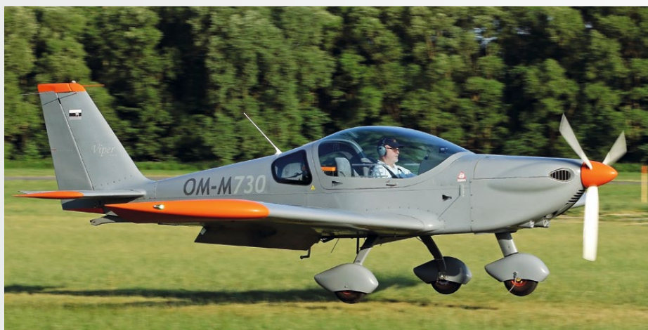
• Pristávanie na Očovej.

Riadiace páky sú vybavené vynikajúcou kombinovanou ergonomickou hlavicou s krížovým ovládačom vyváženia a vypínačom autopilota. Na prednom tlačítku je umiestnený spínač/klúčovadlo rádiostanice. Riadiaca páka je vybavená brzdivou pákou, filozofia použitia je rovnaká, ako je na lietadlách L-29, L-39 či na bojových lietadlách. Keďže je predné podvozkové koleso riadené, nie je potrebné diferencované brzdenie hlavných kolies a systém pracuje mimoriadne jemne a spoľahlivo. Páka brzdy obsahuje aj parkovaciú poistku a keďže systém je uzavretý, brzdenie pri parkovaní je veľmi jednoduché a efektívne. Pozor si musíte dať