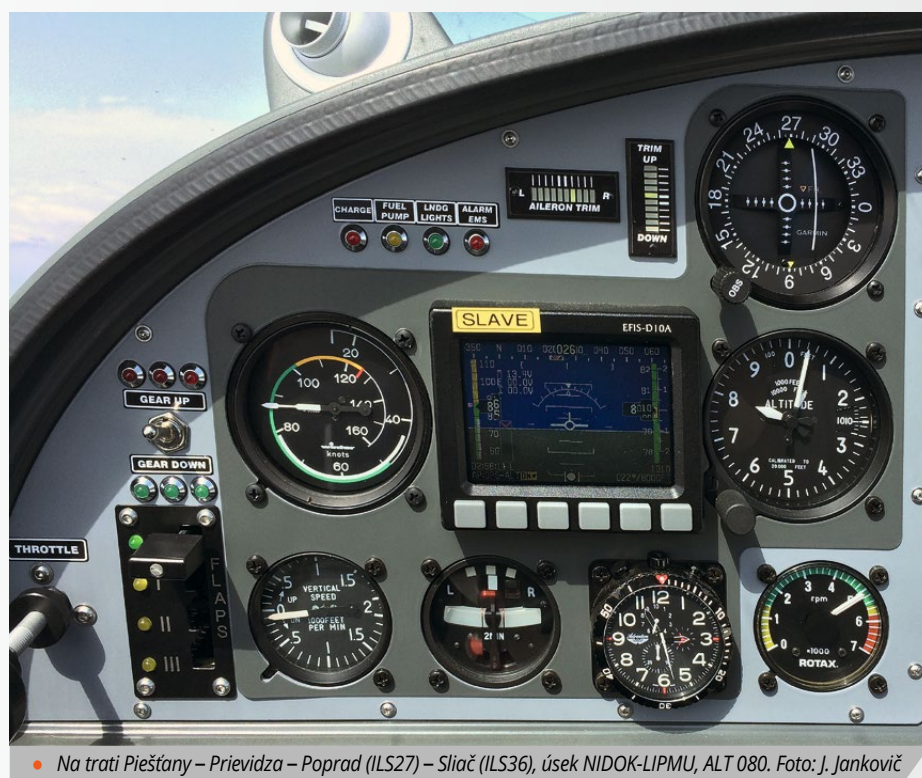
• Na trati Piešťany – Prievidza – Poprad (ILS27) – Sliac (ILS36), úsek NIDOK-LIPMU, ALT 080.

Na stredovej konzole medzi pilotmi je umiestnený hlavný palivový kohút, ktorý umožňuje zvoliť celkovo tri polohy čerpania paliva z nádrží, teda LEFT – BOTH – RIGHT, a sa