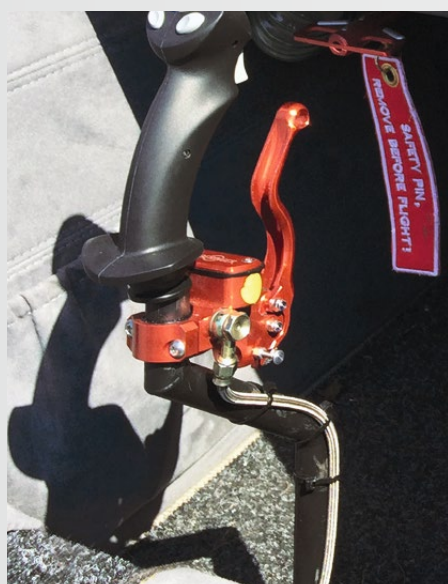
• „Knipel“ a páka brzdy pilota.

Z hľadiska všeobecných letových vlastností nebol pre nás VIPER novinkou, úloha ale bola vyskúšať s ním, v rámci platných obmedzení, maximum z predpokladaných výcvikových úloh. Ako základný rámec poslúžila stará vojenská školská osnova a typický výcvikový „pavúk“ používaný v minulosti, s vylúčením výcviku akrobacie, ale s bežným zahrnutím prístrojového výcviku – samozrejme v podmienkach VMC. Tento výcvikový program z obdobia osemdesiatych až deväťdesiatych rokov minulého storočia totiž predstavoval relatívne najvyzrelejší systém výcviku vojenského letectva. Systém s výsledkom viac než ti-