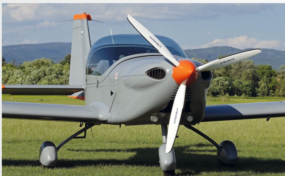
• Parkovanie Očová.

Z technického hľadiska je VIPER celokovový dolnoplošník poháňaný osvedčeným motorom Rotax 912 všetkých verzií s elektricky ovládanými 3-polohovými vztlakovými klapkami a trojkolesovým pevným podvozkom, s klasickým aerodynamickým usporiadaním kýlových plôch. Palivové nádrže zabudované v krídlach pojmu 70 až 100 litrov bežného automobilového benzínu s minimálnym oktánovým číslom 95. Vrtuľa býva obvykle pevná, resp. na zemi staviteľná, ale vyskytuje sa veľa lietadiel aj so staviteľnou vrtuľou rôznych výrobcov, keďže typ vrtule je vecou výberu zákazníka. Piloti sedia vedľa seba, batožinový priestor je za sedadlami, rozdelený na dve uzavierateľné schránky za operadlami a spoločný vrchný priestor. Palubná avionika (samozrejme, okrem EASA certifikovanej verzie) je natoľko rôznorodá, že sa ťažko hľadajú dve rovnako vybavené lietadlá. Je to preto, že rovnako ako farebné vyhotovenie lietadiel je aj palubné vybavenie (avionika) voliteľné podľa požiadaviek