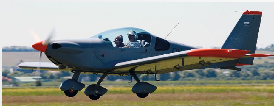
• Nitra, 28. máj 2017, „low-pass“ s veteránom na palube.

Počas 31 letových dní sme na lietadle VIPER AFT s registráciou OM-M730 nalietali 110 letov a v palubnom denníku pribudlo celkovo skoro 65 letových hodín. Postupne sme lietali nielen na všetkých riadených letiskách na Slovensku, všetky možné prístrojové priblíženia, ale polietali sme niečo aj v Čechách, keďže bolo potrebné overiť jeho vlastnosti aj počas dlh-