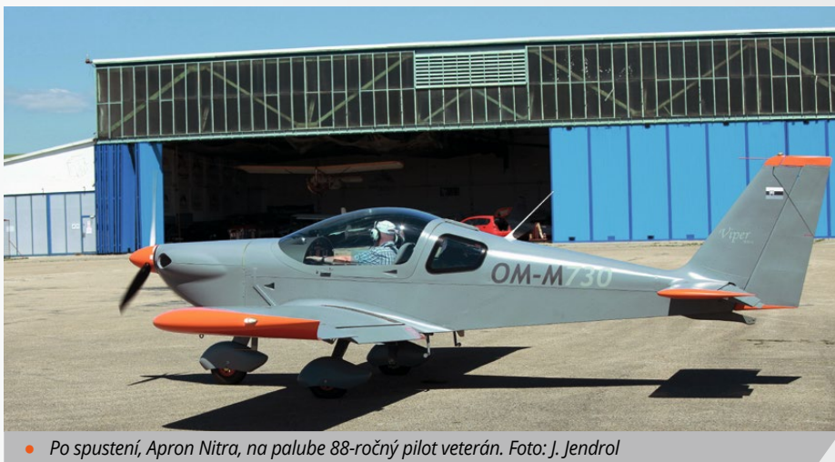
● Po spustení, Apron Nitra, na palube 88-ročný pilot veterán.

síca pilotov, ktorí predstavovali solídny remeselný základ letectva nielen v Československu, ale aj v zahraničí, a to bez vážnych excesov.