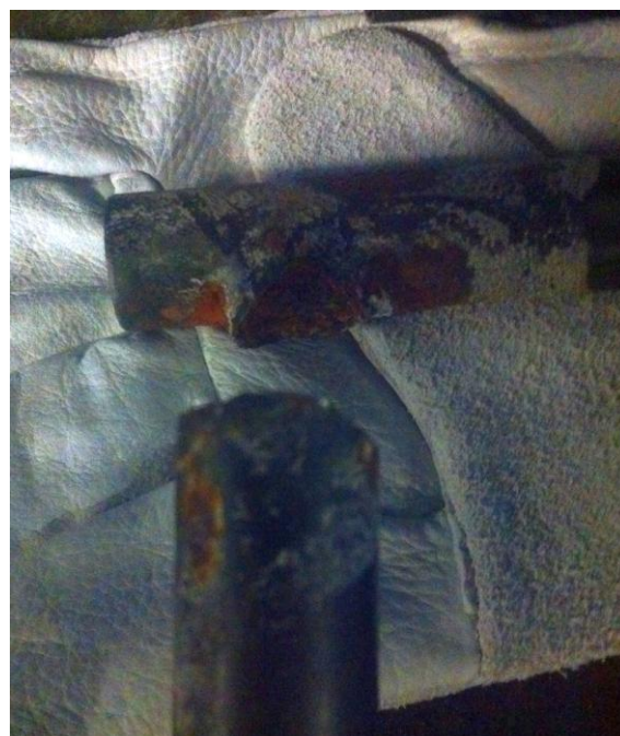
Obrázok 1 – Korózia a prasknutie zvaru rúrkovej konštrukcie padála nožného riadenia Figure 1 - Corrosion and rupture of the weld of the tubular structures of the foot pedal control